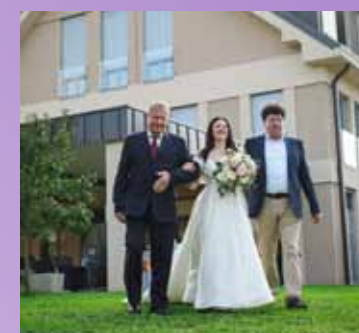
Nevesto sta pred oltar pospremila oče in dedek.