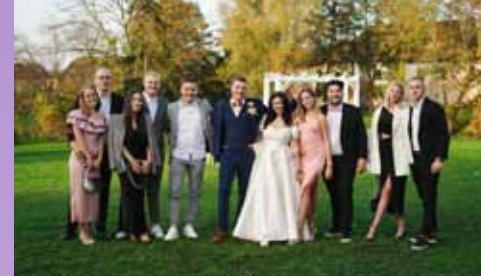
Srečna in zadovoljna mladoporočenca s prijatelji. Za njun bleščeč nasmeš so poskrbeli pri studiu Lux Dental.