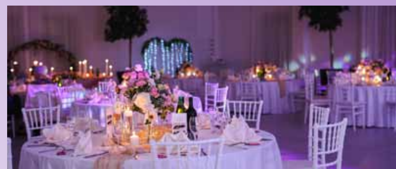
Sanjsko okrašena dvorana, v kateri sta si mladoporočenca prisegla svojo zvestobo.