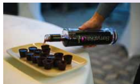
Prekrasno poročno torto so ustvarili pri Zalana, Berryshka pa je svate pockrijala s sladkimi likerji v čokoladnih lončkih.