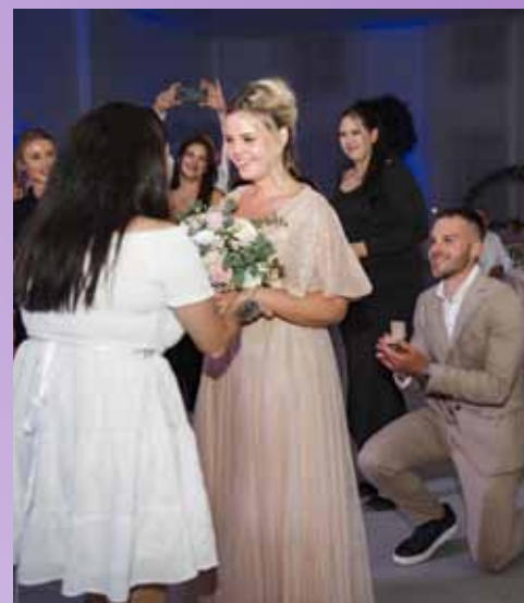
Med poroko se je zgodila še zaroka. Kakšno presenečenje za svate!