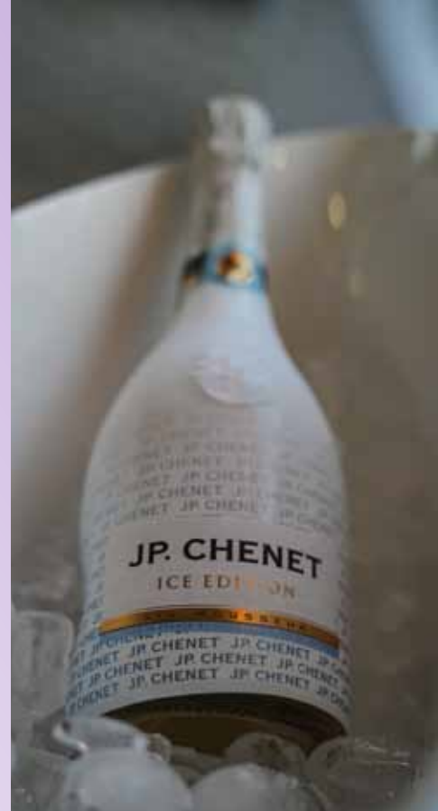
JP. Chenet je poskrbel, da so si svati nazdravljali z njihovo kakovostno penino.