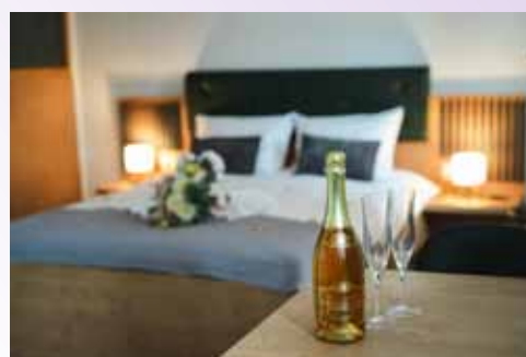
Ženin in nevesta sta se za poroko uredila v apartmajih Ob Krki, kjer so za pričesko in makeup poskrbeli Youma Beauty.