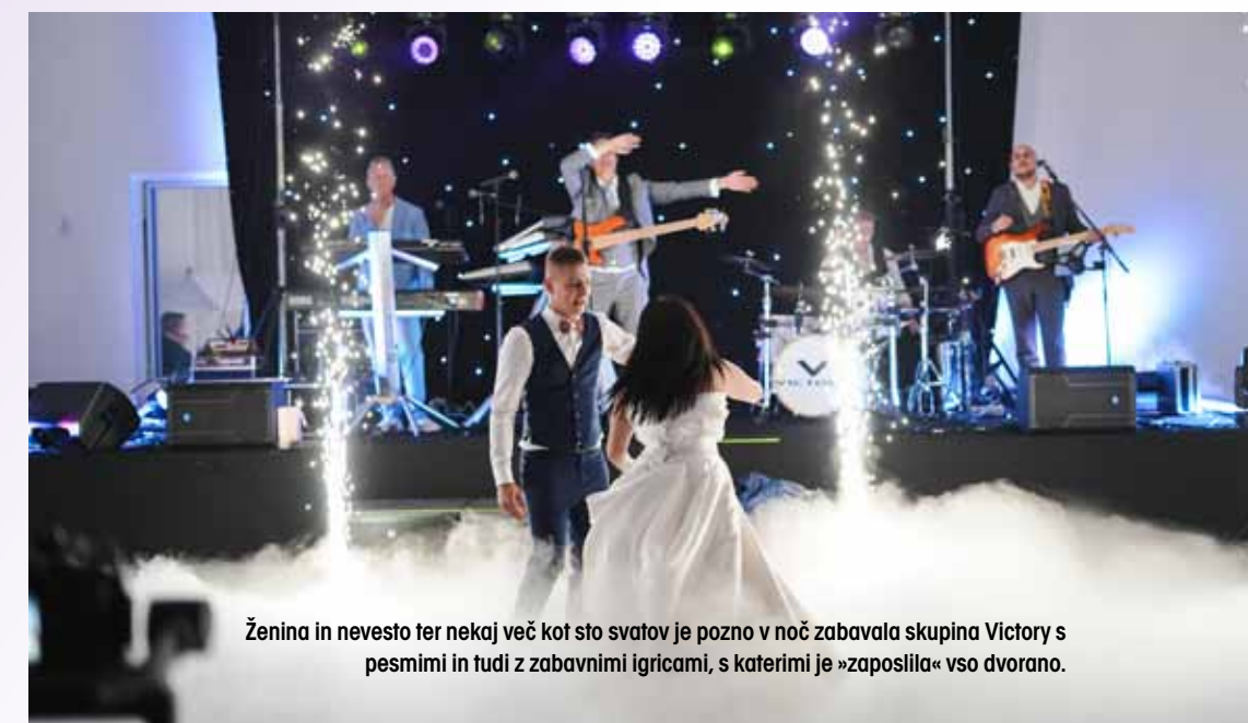
Ženina in nevesto ter nekaj več kot sto svatov je pozno v noč zabavala skupina Victory s pesmimi in tudi z zabavnimi igricami, s katerimi je »zaposlila« vso dvorano.