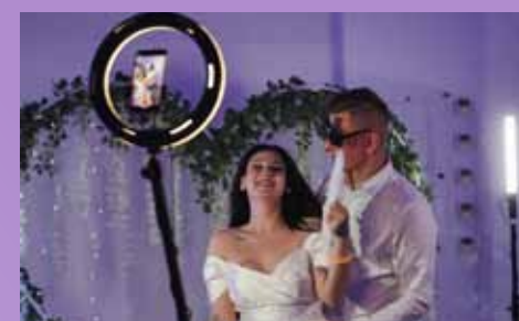
Za popestritev dogodka je v obliki vrtečega se fotokotička poskrbel Spin 360. V tem kotičku je bila gneča ves čas.