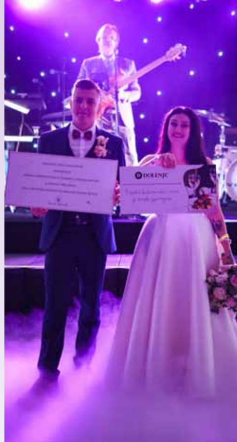
Hotel Plesnik je mladoporočencema podaril romantični vikend oddih in kraljevi sobi, z alpskim eko wellnessom, ajurvedsko masažo in še čim.