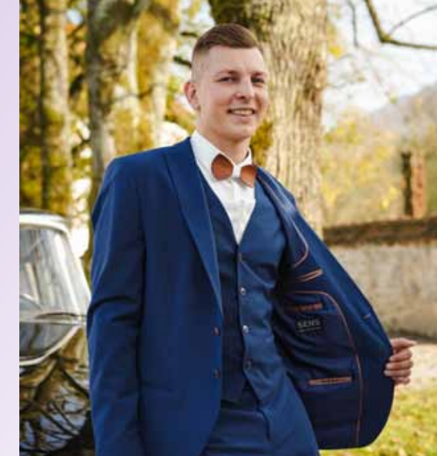
Ženin v oblačilih in dodatkih slovenske blagovne znamke Sens.