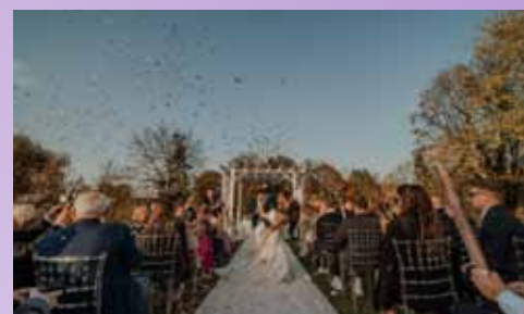
Sanjska poroka na prelepem prizorišču Centra La Vie v Kostanjevici.